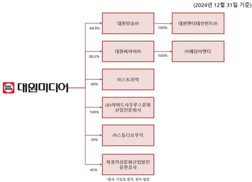
대원미디어 및 계열회사간 계통도